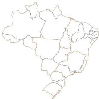
Mapa 1 – Brasil, Grandes Regiões e Unidades da Federação